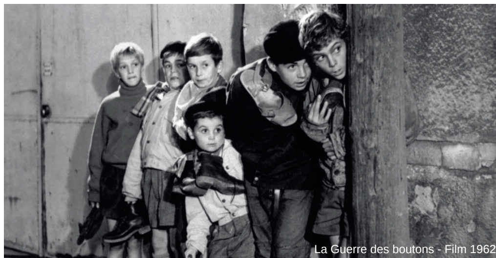
La Guerre des boutons - Film 1962

corps. Ces « petites guerres » nécessitaient toute une préparation. Les élèves fabriquaient des épées en bois et des frondes qui, jugées trop dangereuses, avaient rapidement été bannies. Les pives étaient également utilisées comme projectiles. Chacune des équipes fabriquait