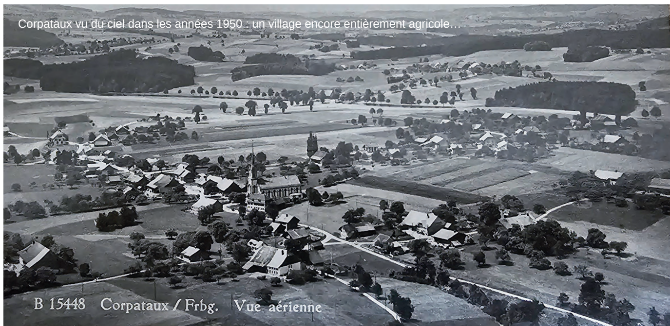
B 15448 Corpataux / Frbg. Vue aérienne