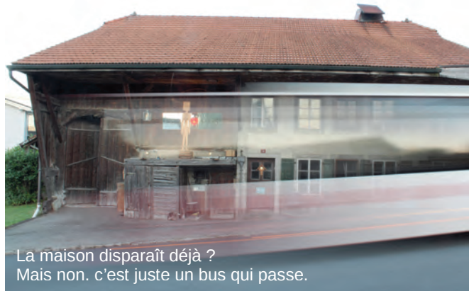
La maison disparaît déjà ? Mais non. c'est juste un bus qui passe.

Des studios de grand standing Prendront sa place sur le trottoir