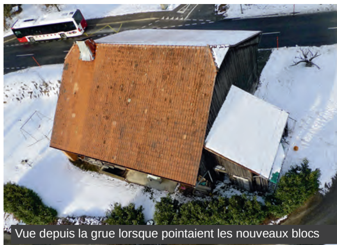
Vue depuis la grue lorsque pointaient les nouveaux blocs

Il y a un peu plus de deux ans, je suis parti, après 27 années de cohabitation entre elle, ma chatte et moi.